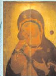
Богоматерь Владимирская. Икона