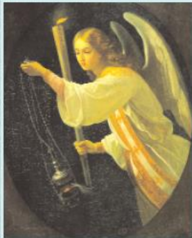
Ангел молитвы. Роспись храма

Слово «православие» означает умение правильно славить Бога, то есть молиться.