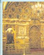
Иконостас в храме

Храм заполнен иконами. Одни из них помещены на стенах, а другие стоят на полу. Это люди. Слово «икона» в переводе с греческого языка означает «образ».